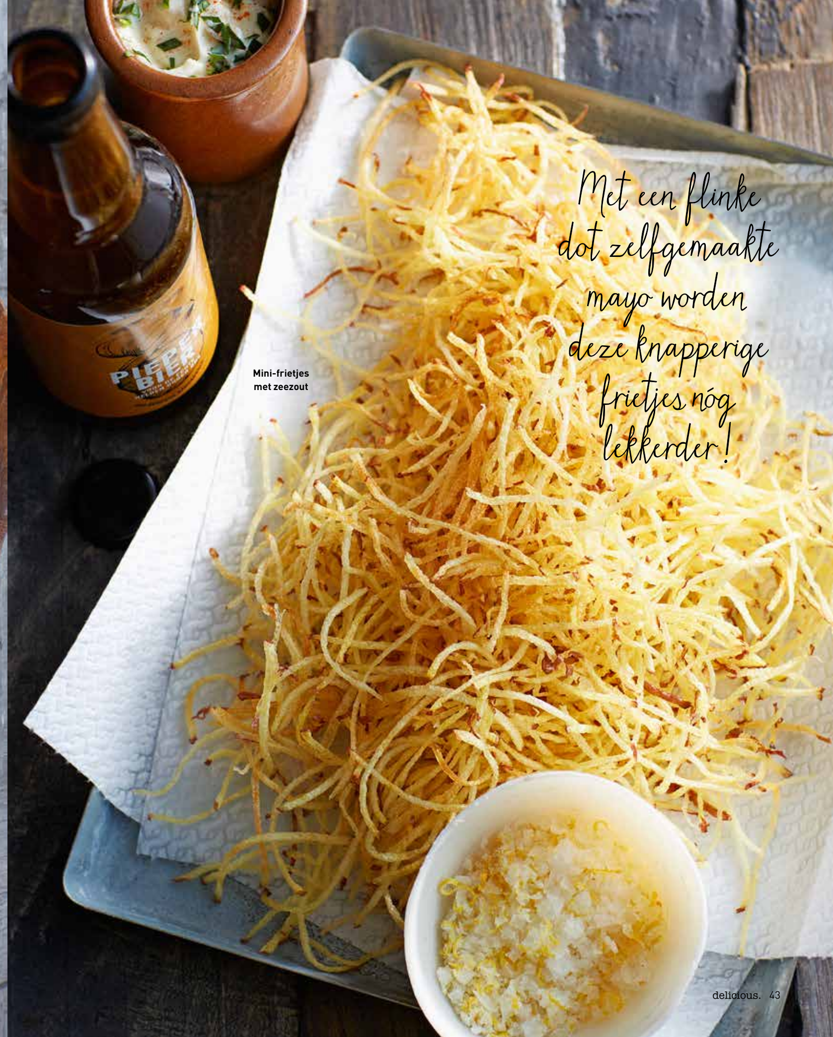
Mini-frietjes met zeezout

Met een flinke dot zelfgemaakte mayo worden deze knapperige frietjes nog lekkerder!