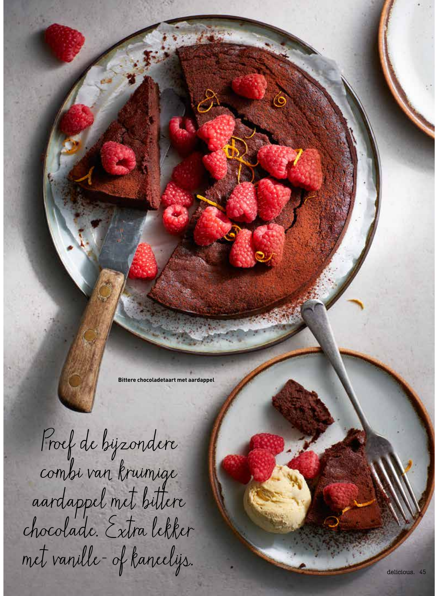
Bittere chocoladetaart met aardappel

Proef de bijzondere combi van kruimige aardappel met bittere chocolade. Extra lekker met vanille- of kaneelijks.