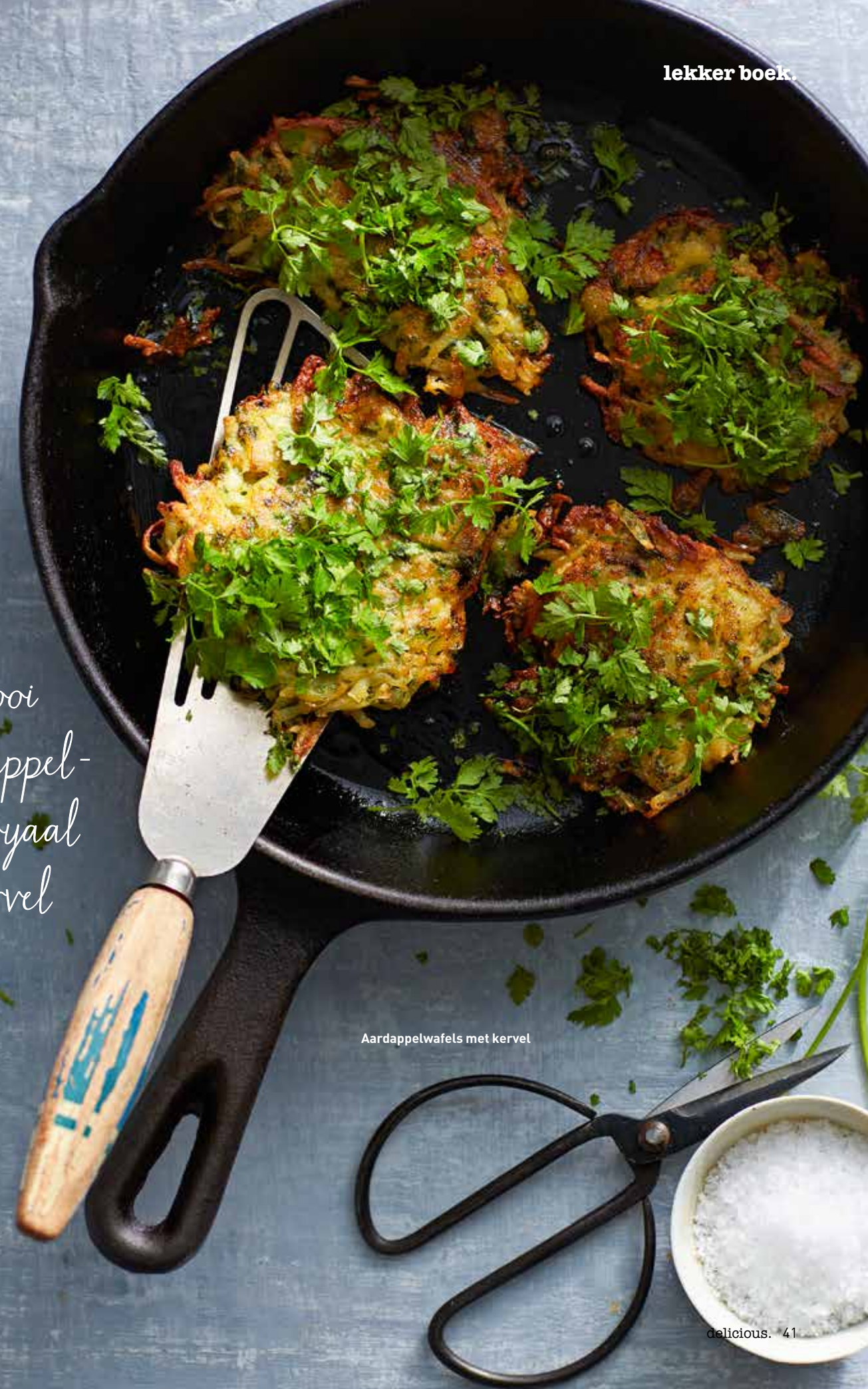
Aardappelwafels met kervel

Bestrooi de aardappel- wafels royaal met kervel